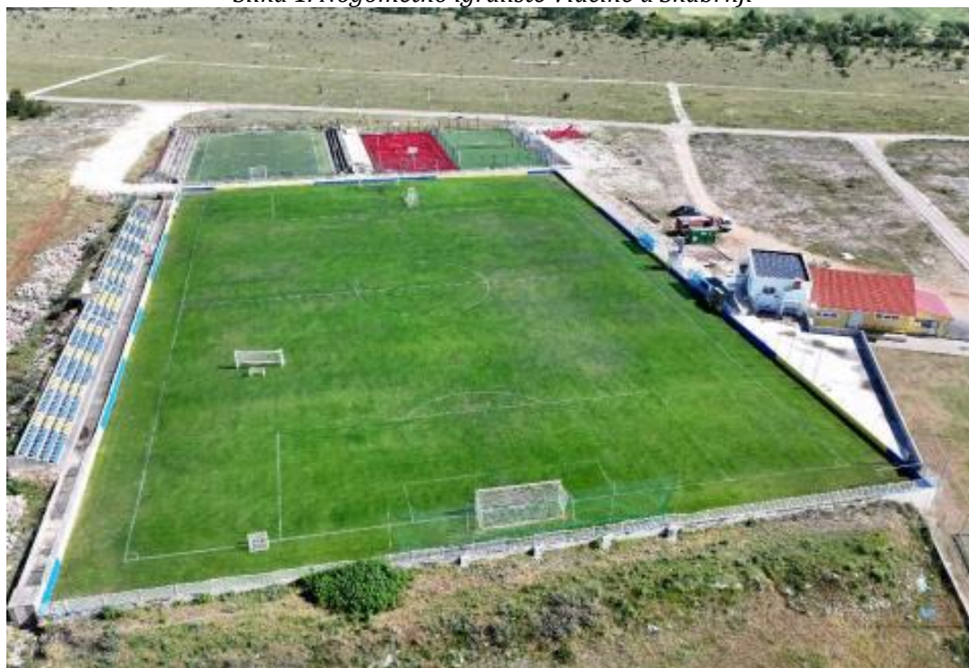
Slika 1. Nogometno igralište Vlačine u Škabrnji